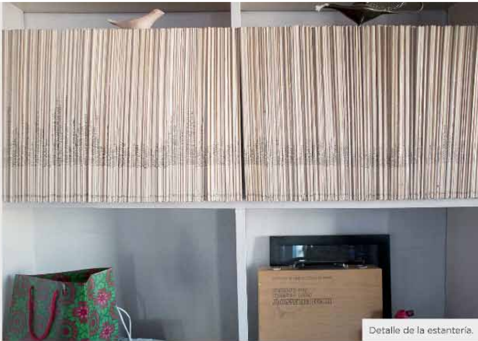
Detalle de la estantería.