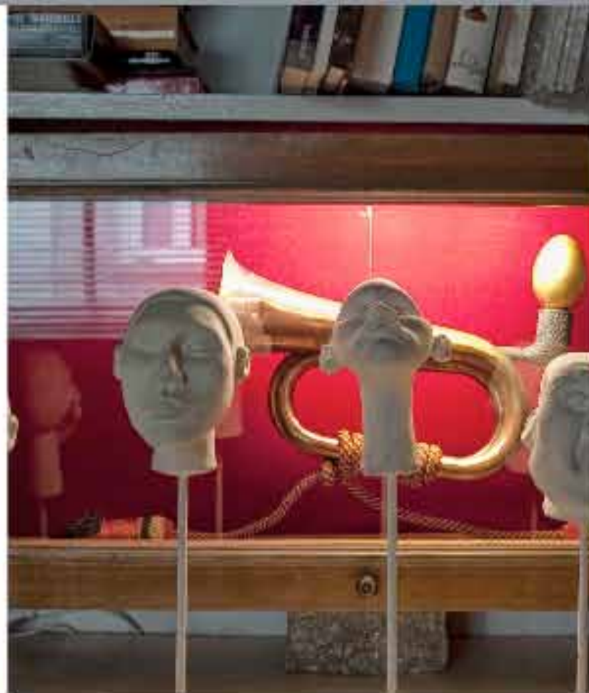
Vista general del estudio y algunas de las esculturas del artista.