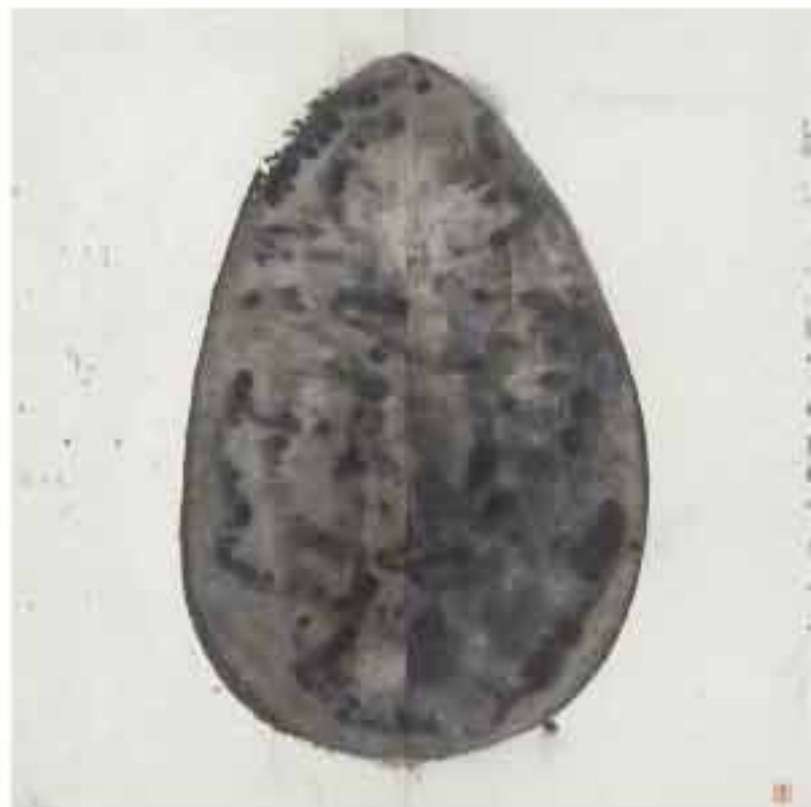
Espacios de Ánimo 1.