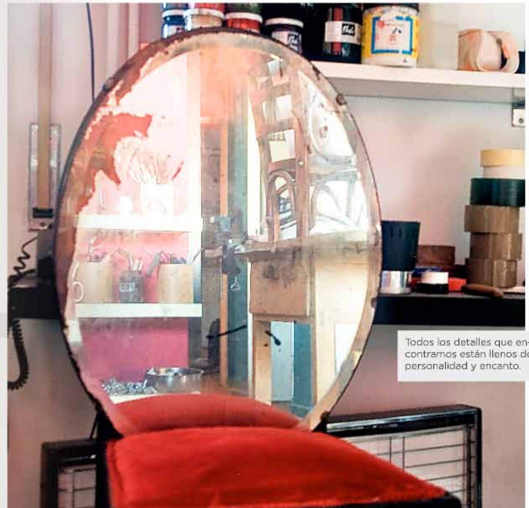
Todos los detalles que encontramos están llenos de personalidad y encanto.

Trabajo en series temáticas porque necesito estar obsesionado con lo que tengo entre manos. Hasta que se agota y empieza otra.