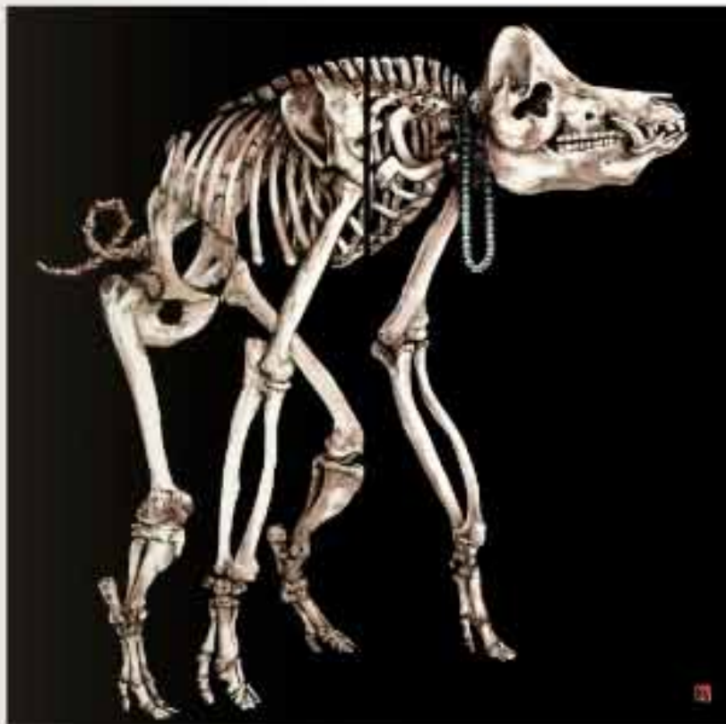
El Fin de la Carne 02w-1.