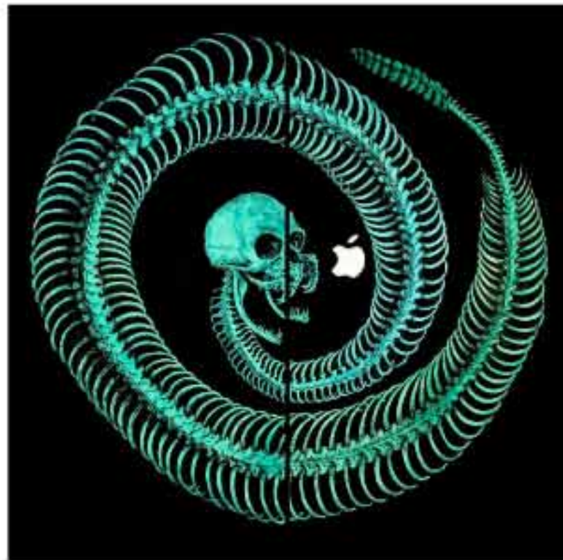
El Fin de la Carne 04w.